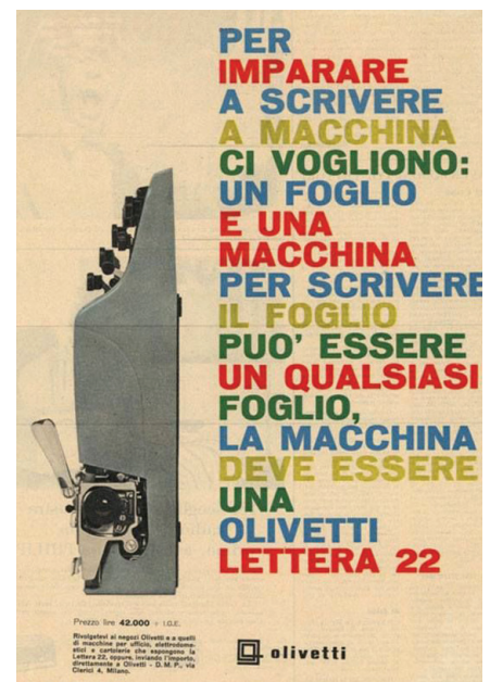
Manifesti e pubblicità della lettera 22. Giovanni Pintori per Olivetti.